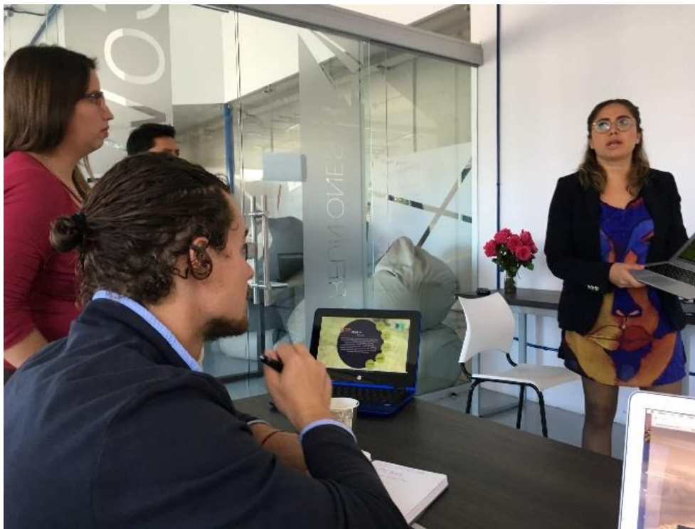
Evento ATAJOS – Cruz Roja