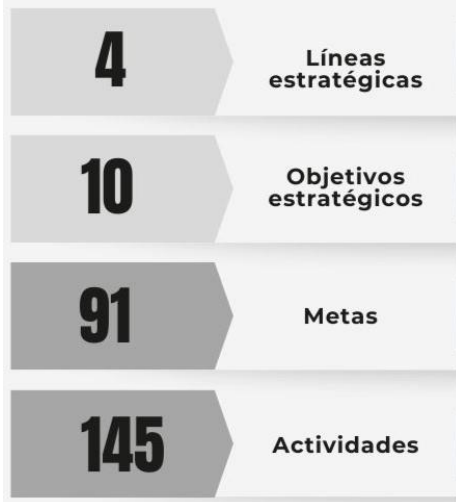
Gráfico 1. Estructura del Plan Operativo Anual 2025.